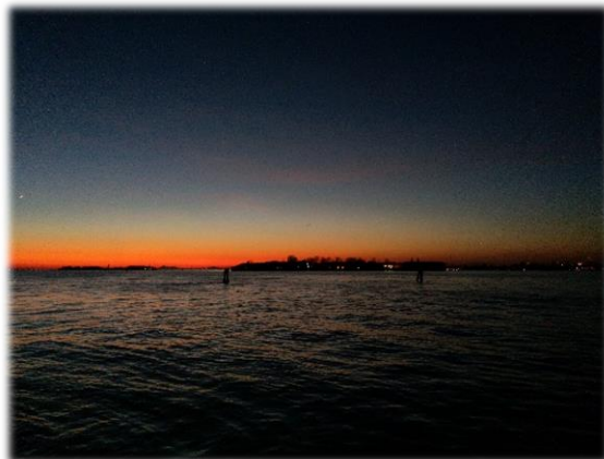
威尼斯麗都島. 義大利