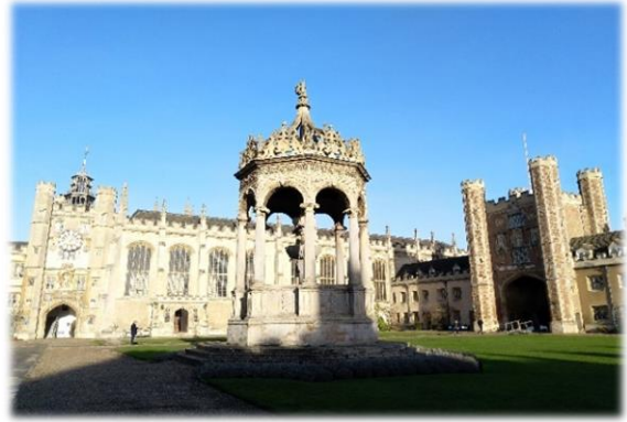
劍橋三一學院. 英國