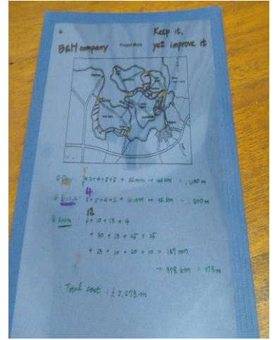
與 Haemin 第一名的小組報告