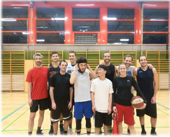
籃球課(可惜考試周只來一半的人)