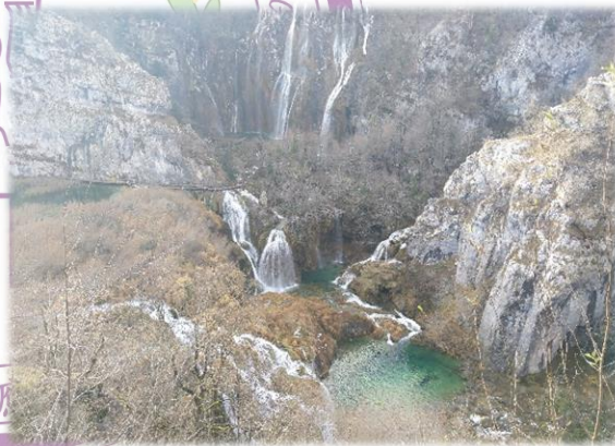
十六湖公園. 克羅埃西亞