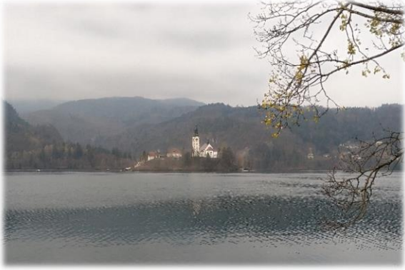
布雷德湖. 斯洛維尼亞