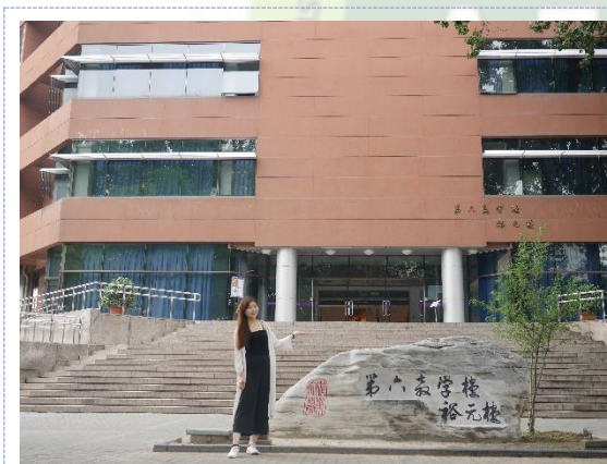
▲清華大學-第六教學樓

無清華不體育： 校內除操場、籃球場、游泳池、羽球場和排球場外，宿舍區也有免費的健身房和瑜珈室，不管在任何時刻都會看見很多清華學生邊運動邊學習，徹底落實學校鼓勵學生課內學習之餘還能以運動來釋放壓力。這也讓平常在台灣每天不走超過兩千步的我，在清華生活每天都是兩萬步起跳，千萬不能小看環境的力量，優良的環境果然能徹底改變一個人的生活步調的。