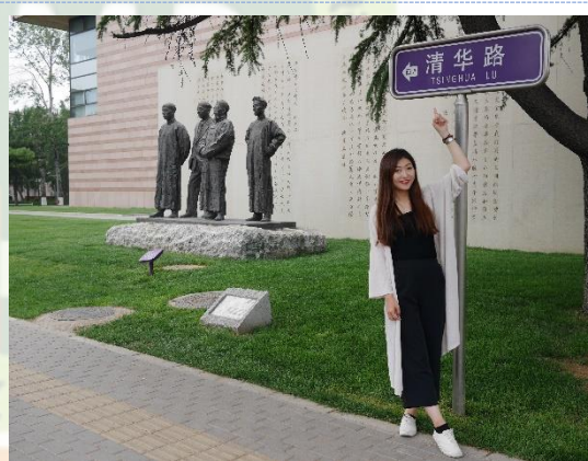
▲清華大學校內景色