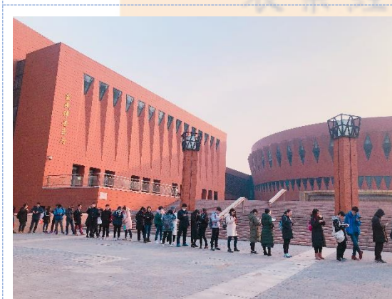
▲清華大學-蒙民偉音樂廳排隊購票