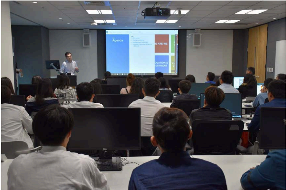
圖 9. 微軟發展與產品功能介紹

參觀辦公室中，看得到像餐廳般舒適的座位，從中看出這個企業所重視的是人與人的溝通，不是只坐在電腦前拼命，人與人面對面的意見交流是必須的；也有提供讓人能專注思考的房間，在絕對安靜的環境下，能夠挖出腦中最深沉的想法。諸如此類的辦公室設計，透露出的是微軟不一般的企業文化，微軟重視員工工作的環境，以最優質的環境激發員工最大的能力，這樣的微軟我認為是相當大器的，提供空間與時間，才能有不斷創新的成就，也才能夠在不斷變遷的世代中站穩腳跟。整體而言，我眼中的微軟