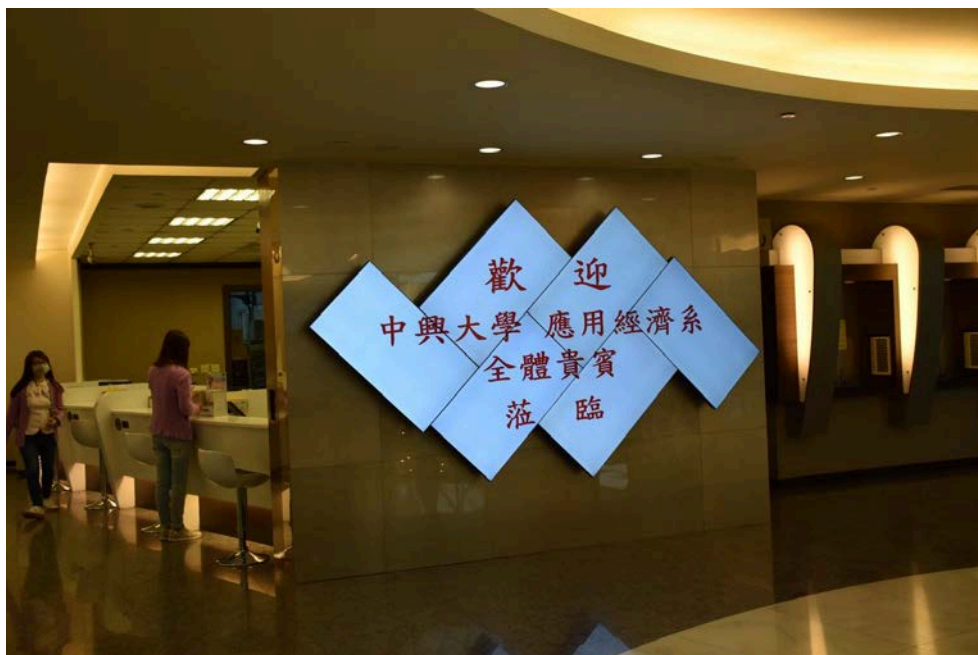
圖 6. 從大廳就能感受到的誠摯歡迎