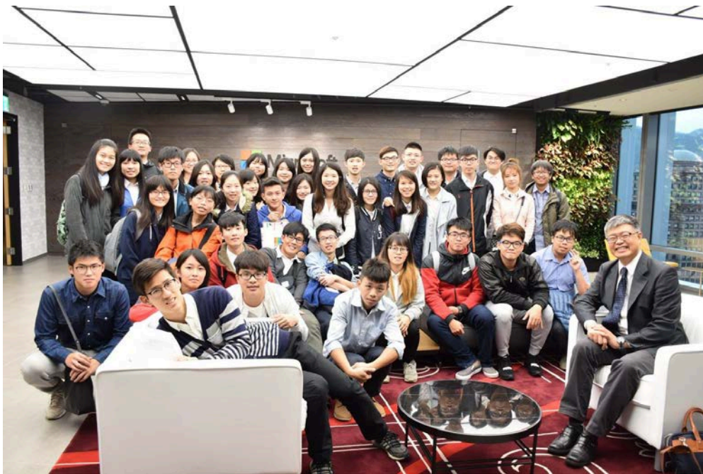
圖 1. 微軟合影

兩天一夜完整的企業參訪行程，像是濃縮了四個企業，紮紮實實的在兩天內把資料在我們腦中建檔，讓我們對這些企業留下了非常深刻的認識，從企業文化、發展沿革、精神目標到人才培育，每個環節都用高強度的說明讓我們能完完整整的了解，企業以如此重視的方式招待我們，更能看出各個企業即使身處高處，依然對基層員工的招募抱有相當高的關注，對此我感到感激及感動，深深的體會到這就是我們所謂的「企業」。