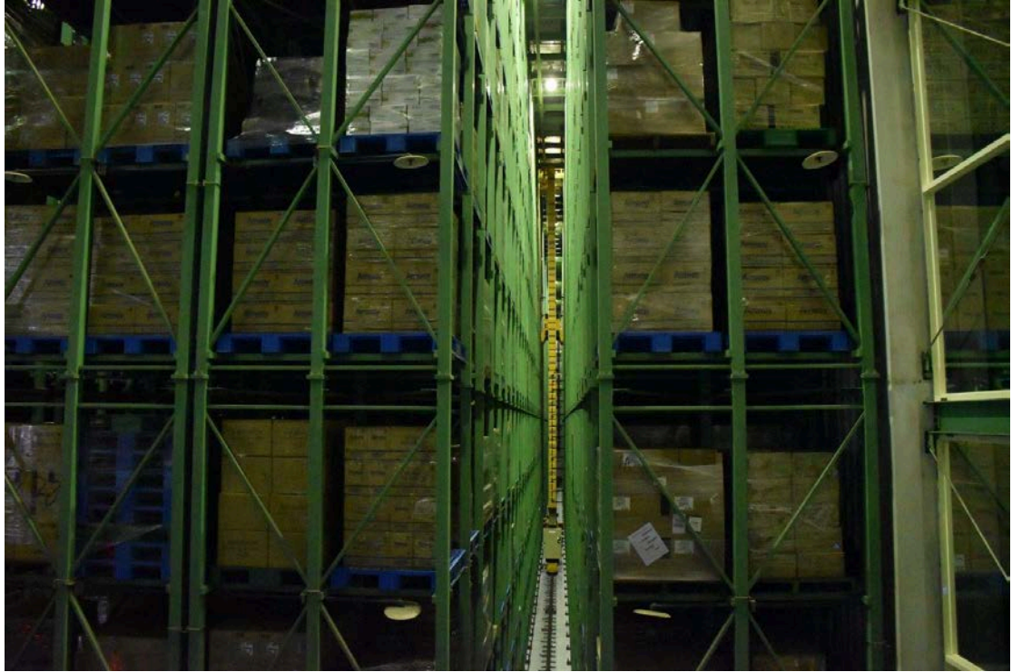
圖 8. 壯觀的無人倉儲系統