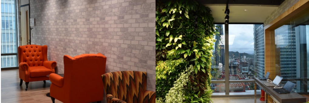
圖 10.11. 開闊視野與溝通空間

是創意激盪、意見交換流通、穩健紮實的企業，作為這樣企業的用戶，我會很放心也會很期待微軟未來的發展。