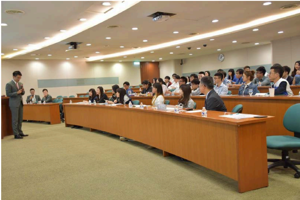
圖 5. 玉山企業精神介紹