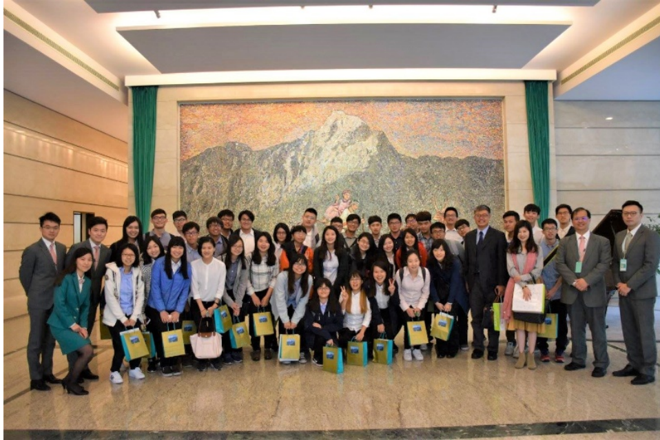
圖 4. 七彩壯闊馬賽克拼貼

玉山金控開始說明玉山的特色和人員具備的特質，帶入金融介紹、人員培訓介紹，接著進行實際參訪，走過中心的教室、圖書館、餐廳，我發現玉山金控對於新進人員有著紮實且嚴謹的訓練，金融工作的各個技能和知識的教導、口語表達及思路彙整的能力，只要有哪項不達及格的標準就會面臨淘汰，在這樣高強度的訓練下鍛鍊出來的人員，才能成為玉山為客人服務的支柱。我認為玉山金控是個重視基礎能力及人格特質的企業，從人員培訓也能看出玉山在設計重重關卡時，皆是為了保障金融交易穩定所付出的努力。