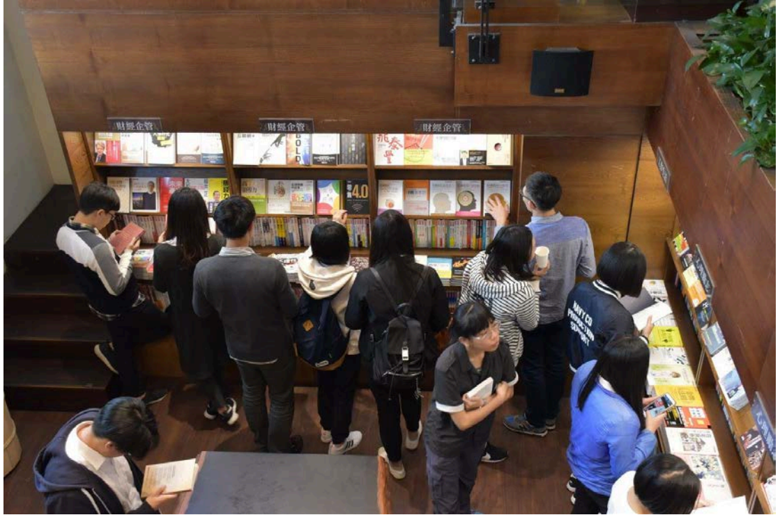
圖 3. 在人文氣息中，自由閱讀